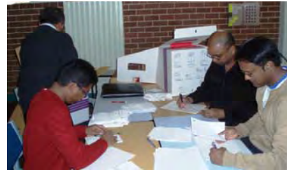
Counting the votes cast