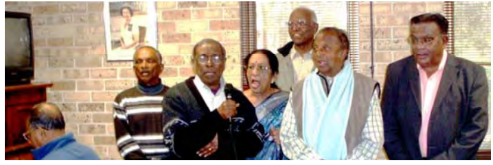
Our birthday choir