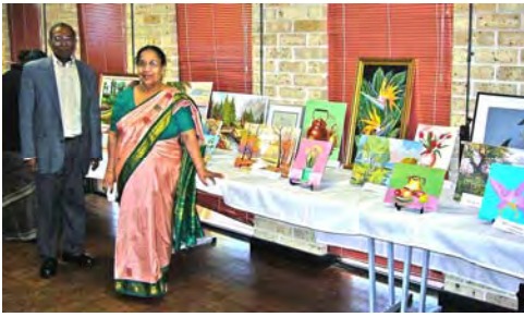
Handicraft Exhibition 2008