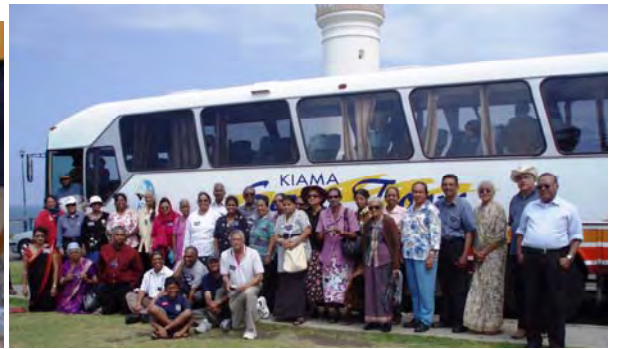
Visit to Kiama