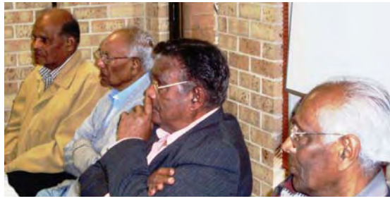
Confronting the Storming of the Bastille