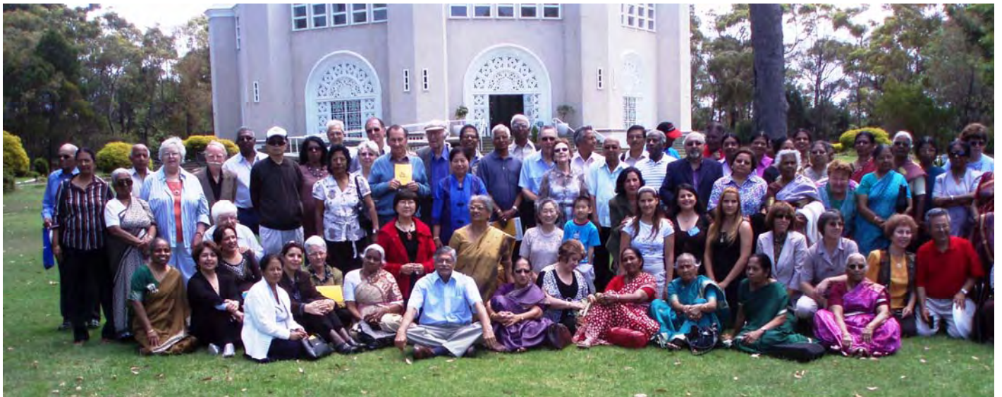
Visit to the Bahai Temple