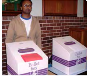
Guarding the ballot boxes