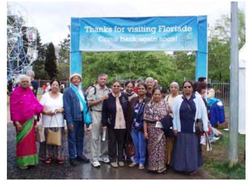
The Floriade - Canberra